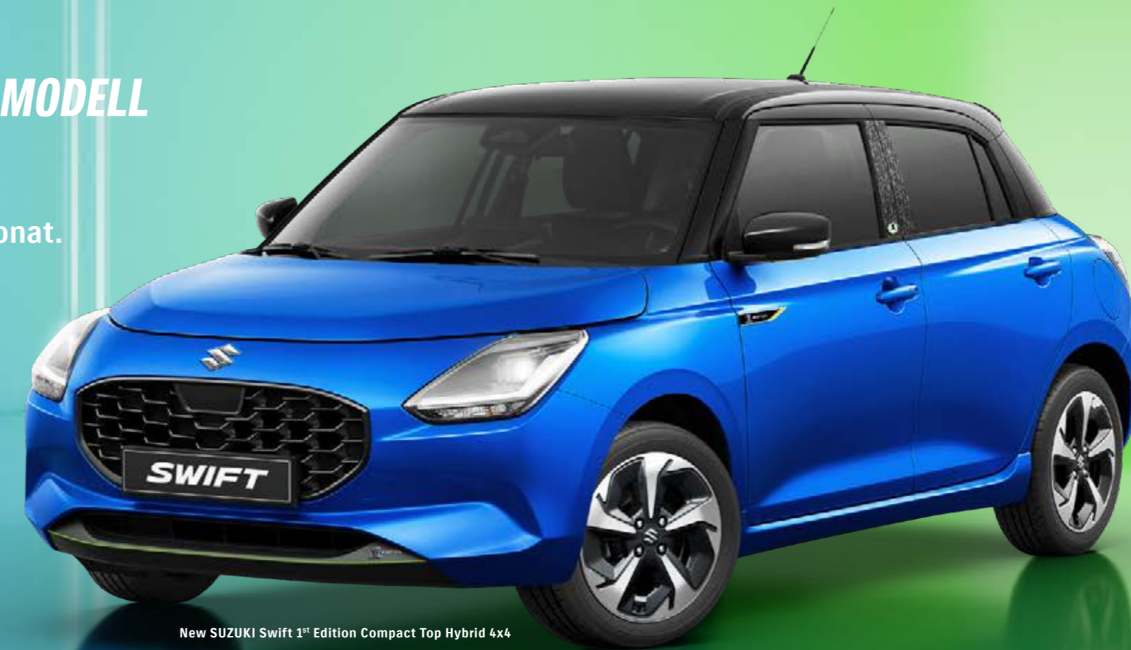
New SUZUKI Swift 1 st Edition Compact Top Hybrid 4x4

SUZUKI KÖNIGSPARTNER ESAF 2025 GLARNERLAND+